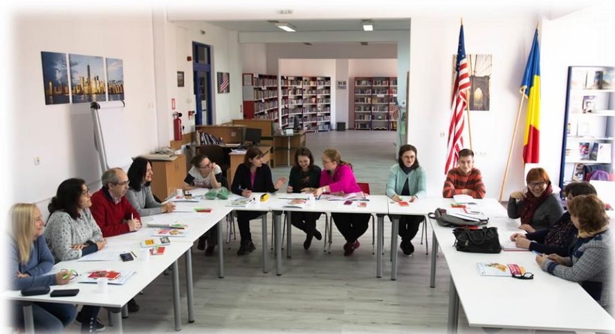
Membrii echipei proiectului în timpul sesiunilor de lucru