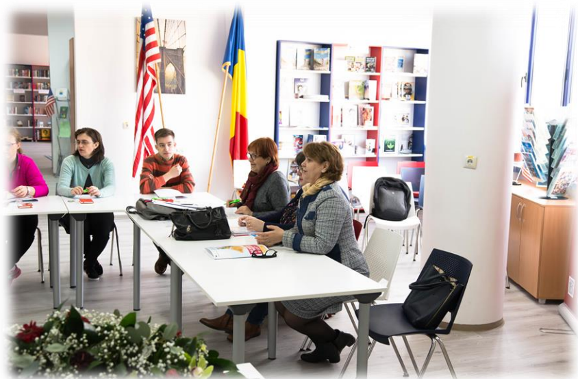
Membrii echipei proiectului în timpul sesiunilor de lucru