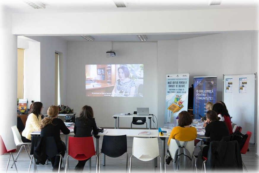
Membrii echipei proiectului în timpul sesiunilor de lucru