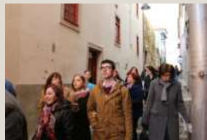
Cina culturală cu muzică Fado