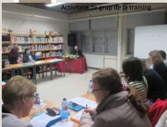
Activitate de grup de la training