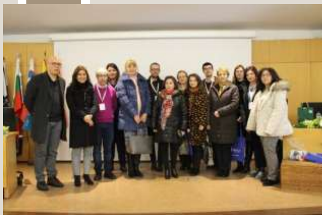
Fotografie de grup cu membrii echipei de proiect împreună cu consilierul pe probleme de educație a primăriei orașului Braga