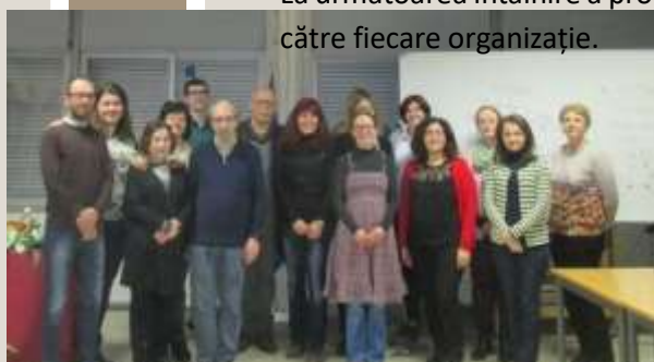
Grupul în ultima zi a întâlnirii, la Școala AETSM

La următoarea întâlnire a proiectului vom avea feedback despre pilotarea programului de instruire de către fiecare organizație.