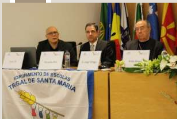
Ceremonia de deschidere cu directorul AETSM, primarul orașului Braga și Arhiepiscopul.