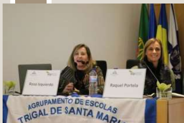
Unul dintre numeroșii specialiști prezenți la acest seminar internațional.