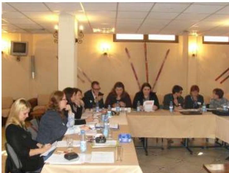
Membrii echipei de proiect în timpul sesiunilor de lucru