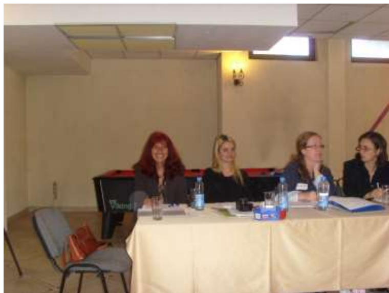
Membrii echipei de proiect în timpul sesiunilor de lucru