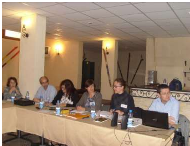
Membrii echipei de proiect în timpul sesiunilor de lucru