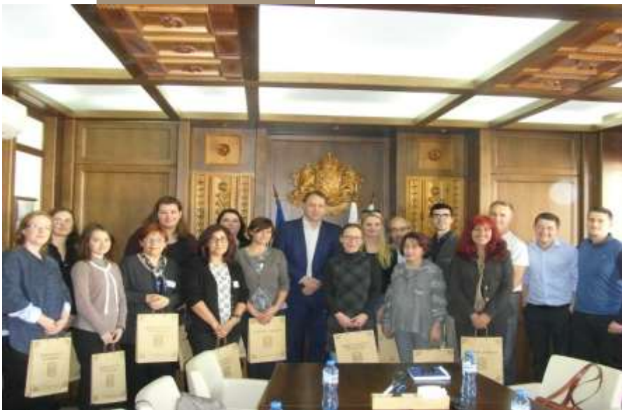
Vizită la Primăria orașului Bansko

Eveniment comun de instruire, de scurtă durată, a personalului din proiect Braga, Portugalia (12 -16 Februarie, 2018)