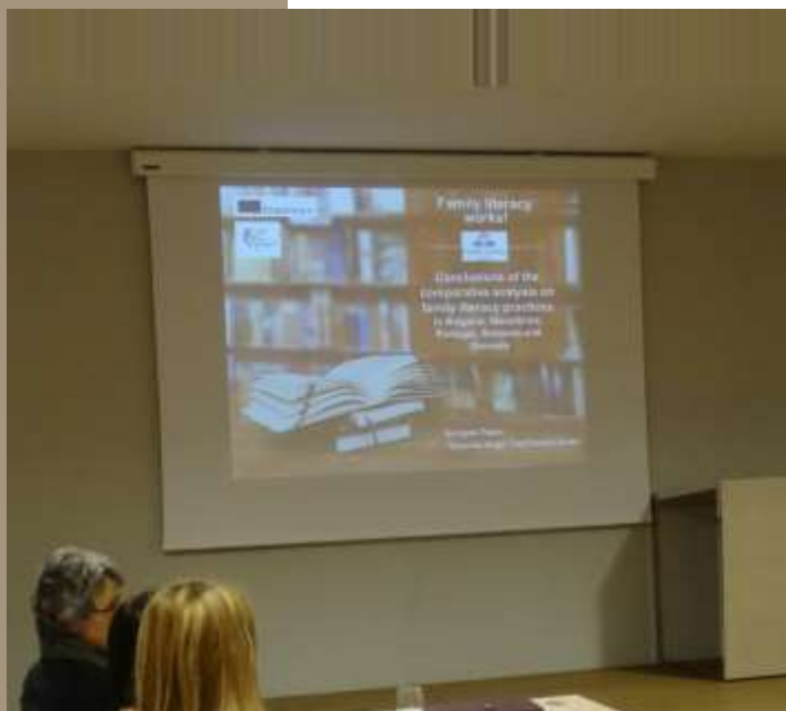
A doua întâlnire în Kranj, Slovenia