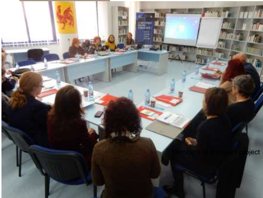
Prima întâlnire în Cluj-Napoca, România