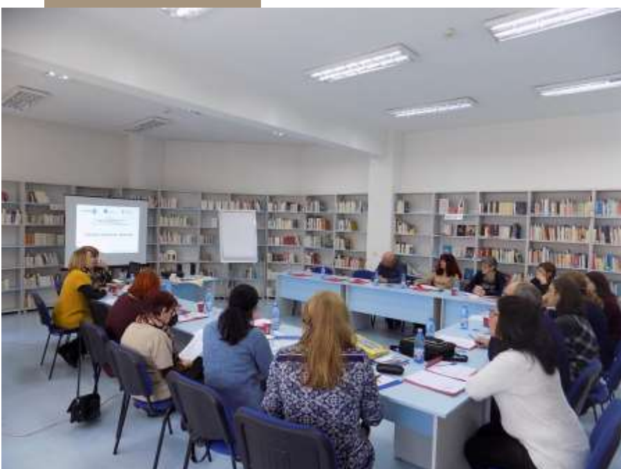
Prima întâlnire în Cluj – Napoca, România

Literația pentru familie este o metodă de educație. La baza acestei metode stă credința că „părintele este primul dascăl al copilului său”. Părinții educați sunt mai capabili să susțină procesul educativ al copiilor. Dezvoltarea unor programe de literație pentru familie este cea mai eficientă strategie de creștere a gradului de implicare a părinților și a dezvoltării intelectuale. Scopul elaborării unui curriculum de literație pentru familie este acela de a crește performanțele academice ale participanților. Prin aceste programe de literație pentru familie, părinții susțin educația propriilor copii.