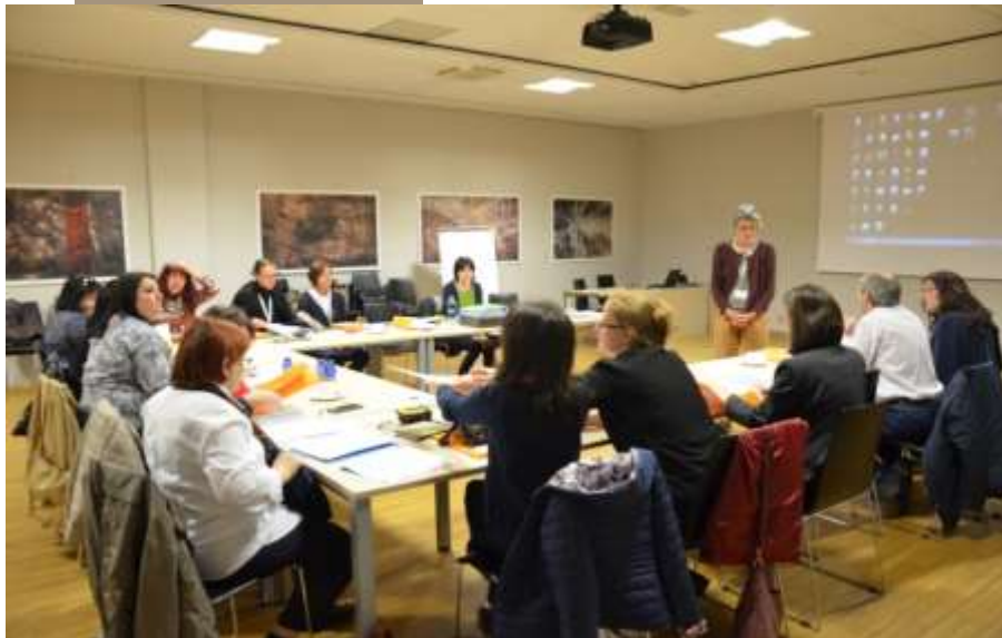
Întâlnirea membrilor proiectului la Kranj