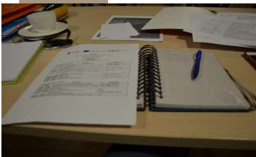
Întâlnirea membrilor proiectului la Kranj