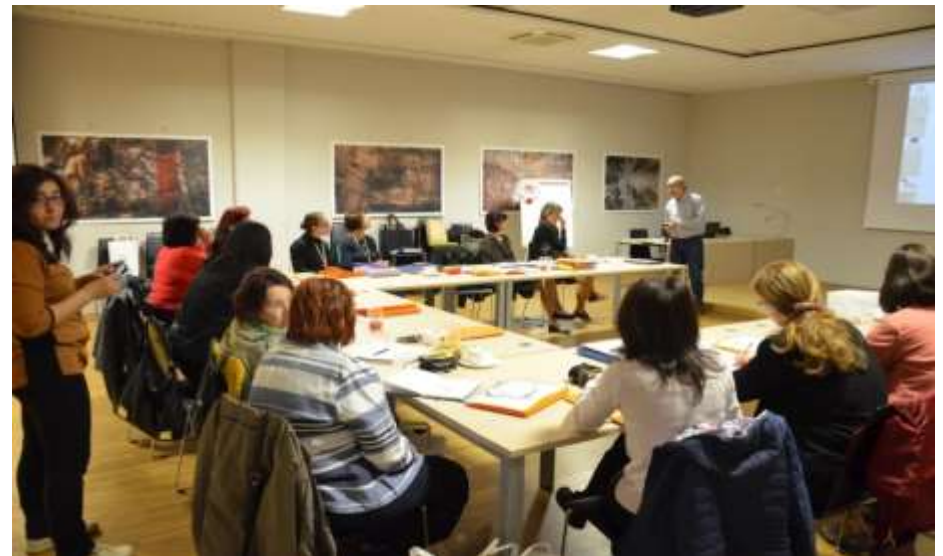
Întâlnirea membrilor proiectului la Kranj