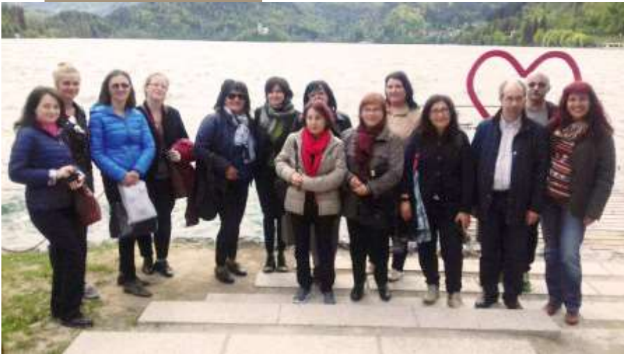
Membrii echipei de proiect